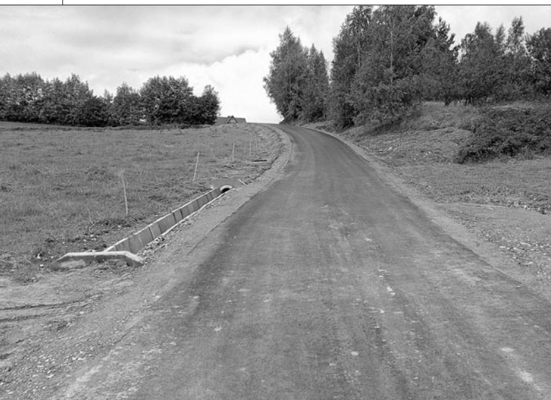
Droga do os. Górki w Lubomierzu

na. Z Funduszu Dróg Samorządowych przeznaczono na tę inwestycję kwotę 3 mln 562 tys. 662 zł. Powiat Limanowski zaangażował na ten cel środki własne w kwocie – 2 mln 749 tys. 969 zł., natomiast Gmina Mszana Dolna – przeznaczyła ze swego budżetu 928 tys. 311 zł. na modernizację drogi w Łostówce.