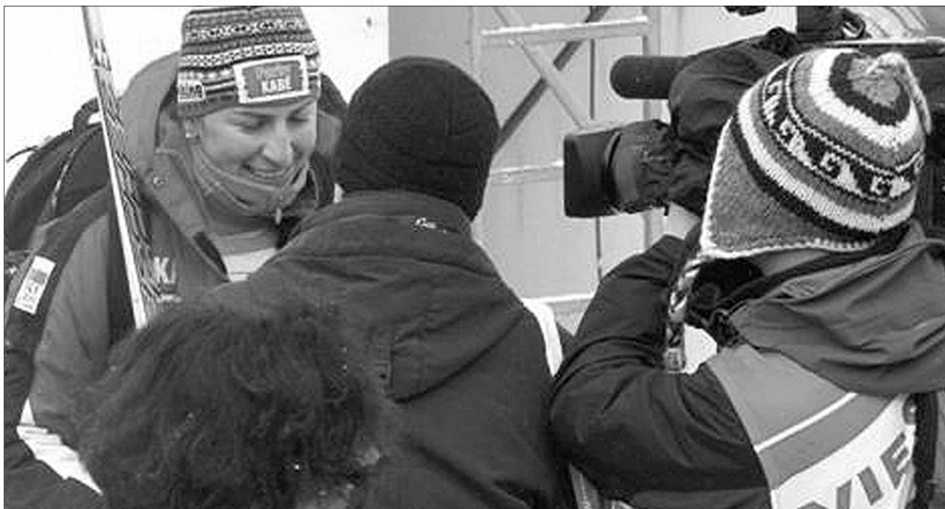
Największych fanów Justyna Kowalczyk ma w rodzinnej Gminie Mszana Dolna

Dla Justyny Kowalczyk to sezon wi cej ni olimpijski