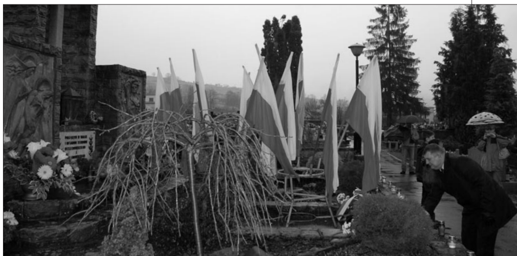
Wójt składa kwiaty na cmentarzu