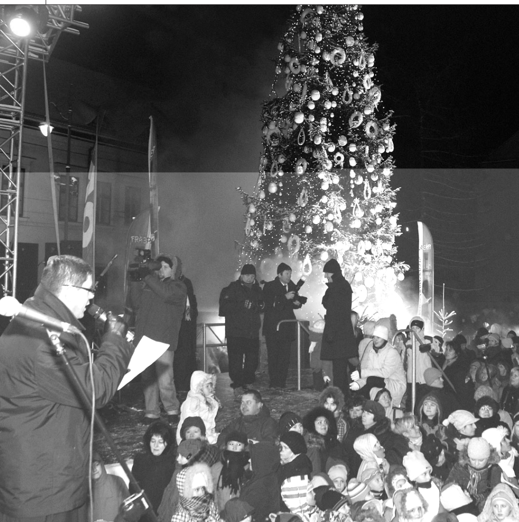
Uroczystość rozświetlenia choinki pod „oknem papieskim” zgromadziła tłumy krakowian i gości z gminy Mszana Dolna