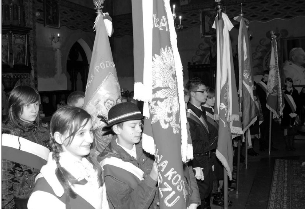
W szpalerze pocztów sztandarowych stały szkolne proporce