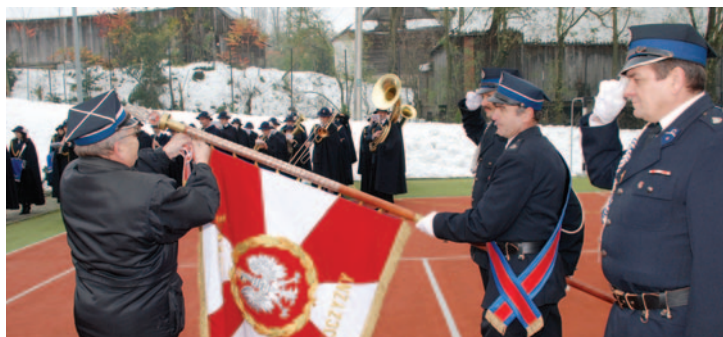
Złoty jubielusz OSP w Łostówce – str. 11