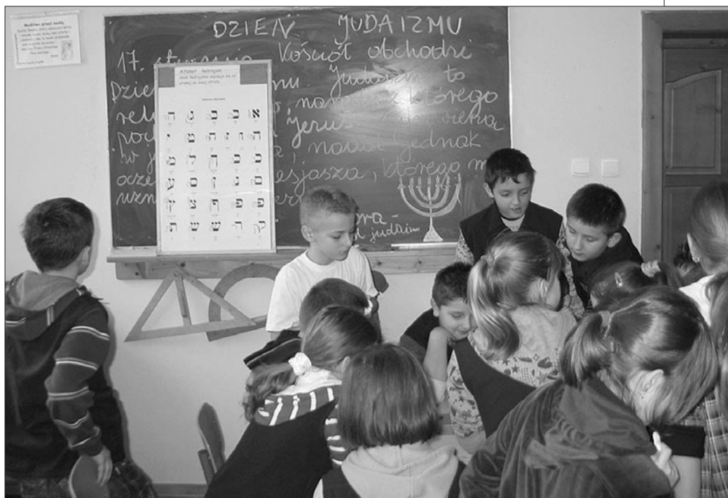
Warsztaty kaligrafii hebrajskiej

Dzieci dowiedziały się zatem, czym w istocie jest judaizm, jakie są jego główne święta, język i obrzędowość. Uczniowie mogli spróbować sił w podstawach kaligrafii hebrajskiej, zobaczyć Biblię pisaną w tym języku, modlitewniki, a nawet odtworzony amatorsko zwój Tory. Dowiedziały się, jaki jest stosunek Kościoła kat. do judaizmu i dlaczego antysemityzm jest grzechem. Słuchały