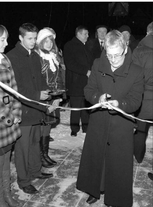
Przecięcie wstęgi na „Orliku” w Mszanie Górnej