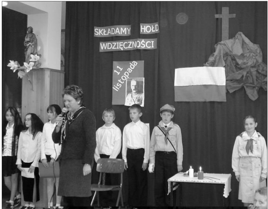
Akademiię przygotowali uczniowie z klas IV-VI

Uczniowie, którzy wystąpili podczas akademii otrzymali gromkie brawa