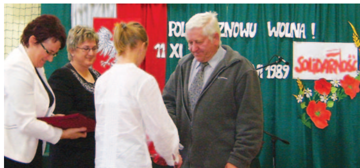
Karty historii w Kasince Małej – str. 26