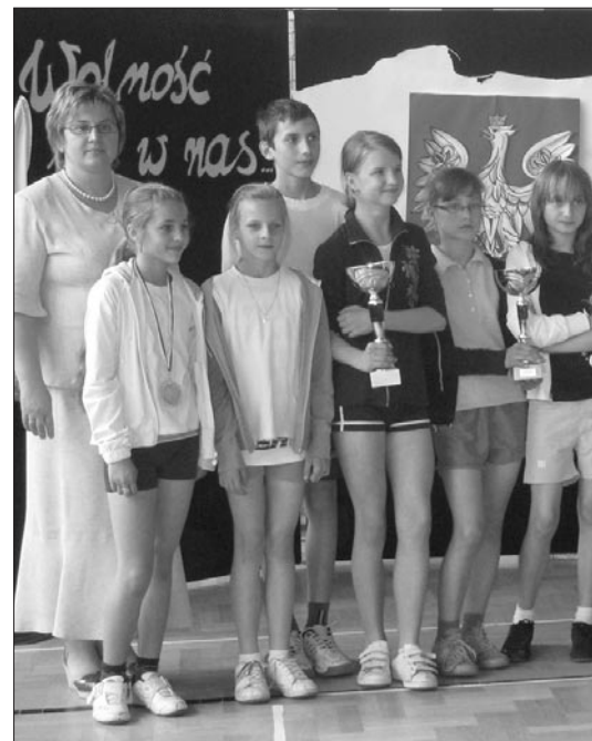
W „biegu wolności” wzięło udział około 300

Podsumowaniem realizowanego projektu było spotkanie ze świadkiem histo-