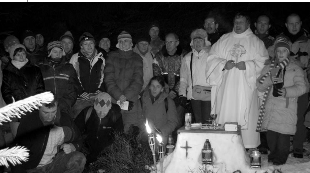
Msza św. noworoczna na szczycie Śnieżnicy