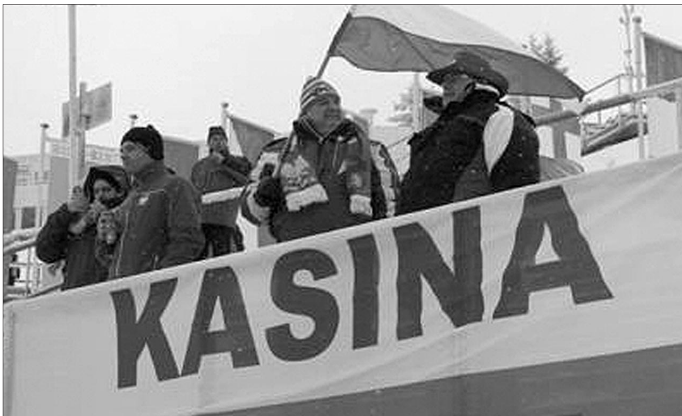
Kibice z Gminy mszana Dolna na zawodach Pucharu Świata w Libercu

metra przed metą, wtedy kasinianka przeprowadziła decydujący atak. Zmęczona Słowenka nie była w stanie odpowiedzieć i Justyna samotnie pomknęła do mety. Prestiżowe zwycięstwo stało się faktem, choć w prywatnym rankingu nasza zawodniczka stawia je na czwartym miejscu (po IO, MŚ, PŚ), to ma ono wielkie znaczenie psychologiczne w perspektywie igrzysk.