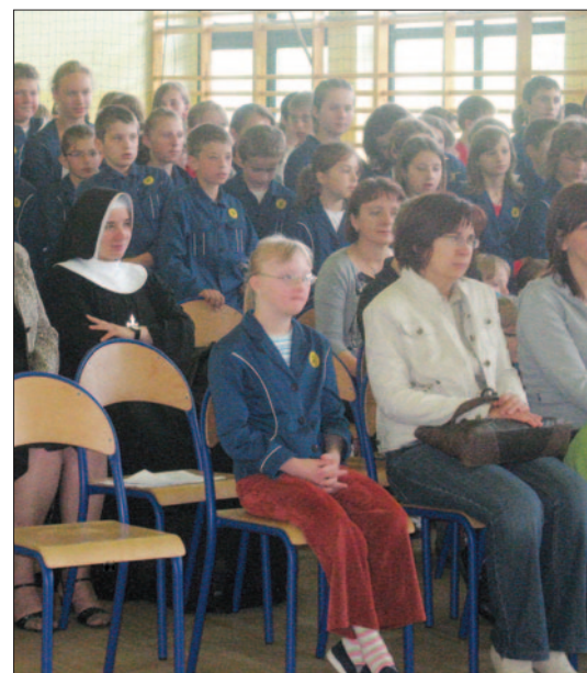
Uczniowie uhonorowali ludzi, którzy przed

Wszechkierne Sejmowej pani przewodnik dokładnie zapoznała uczniów z zasadami pracy parlamentu polskiego. Każdy uczeń miał możliwość zasiąść w ławie poselskiej i trzymać w ręce laskę marszałkowską.