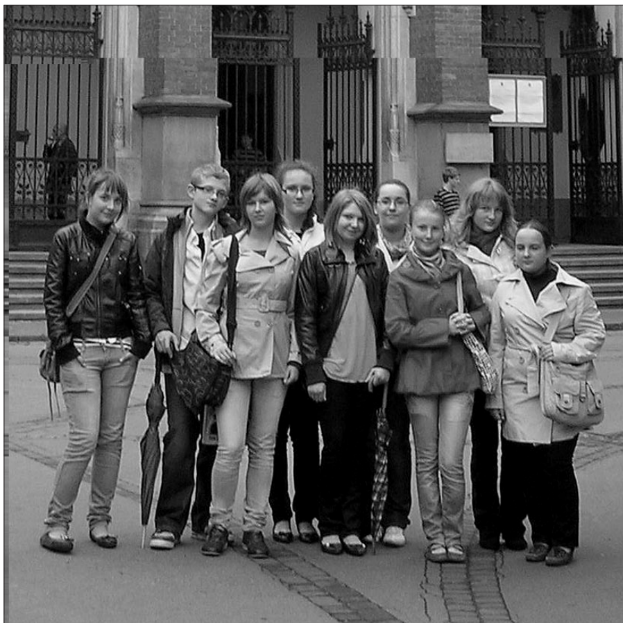
Gimnazjaliści z Mszany Górnej pod gmachem Collegium Novum UJ w Krakowie

Pomiędzy wykładami nastąpiła półgodzinna przerwa, kiedy słuchacze mogli posilić się i nieco ochłodzić. Na koniec uczniowie z I Liceum w Chrzanowie zademonstrowali krótką prezentację pt. „Polskie Termopile. Obrona odcinka Wizna”. Niespodzianką było pokazanie filmu o szwedzkiej grupie rockowej „Sabaton”, która nagrała piosenkę poświęconą kapitanowi Raginisowi, bohaterowi walk w obronie Wizny.