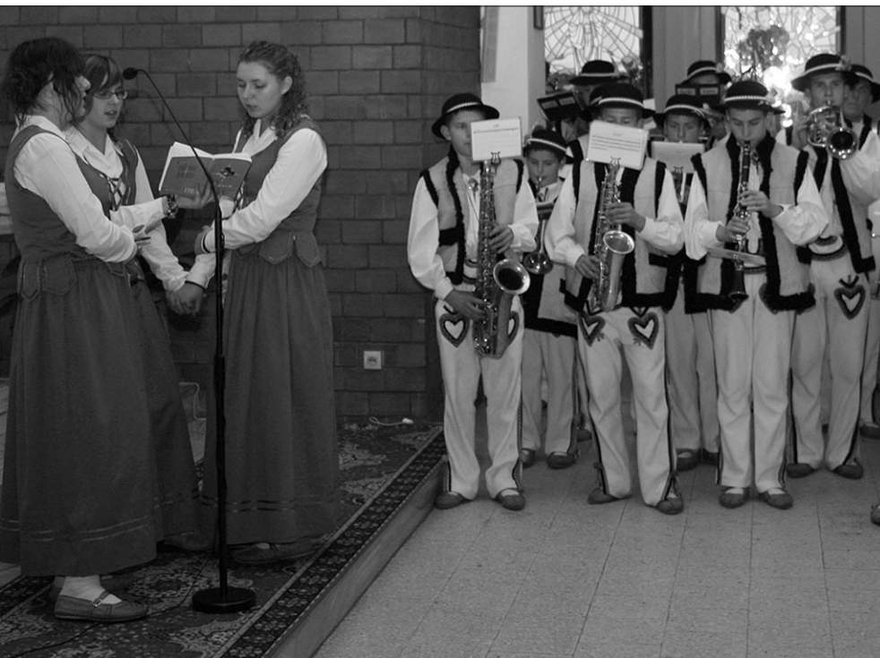
Koncert orkiestry „Sami Swoi” w Żywociach