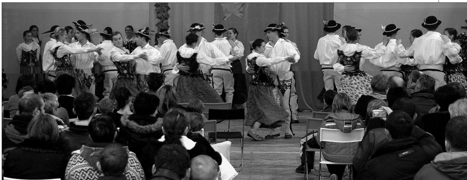
Górale zagórzańscy szybko nauczyli się tańców orawskich