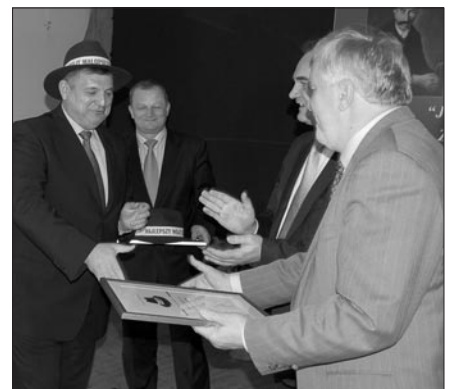
Witosowe Kapelusze wręczył laureatom konkursu wicepremier Waldemar Pawlak