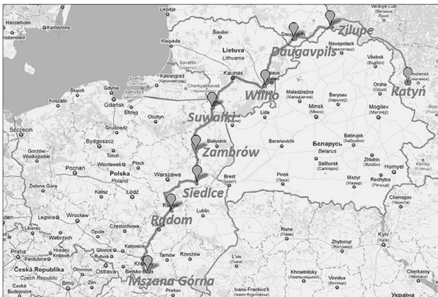
Droga do Katynia

stu, jednak po krótkiej chwili każdy znalazł coś dla siebie.