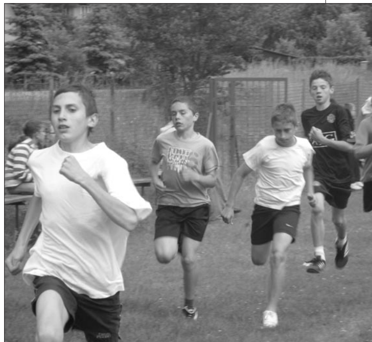
zawodników, którzy swoją sportową postawą upamiętnili wydarzenia sprzed 20 lat

uczniom jedynie z podręczników i książek. Okazuje się, że odkrywanie historii nie musi się wiązać wyłącznie z lekturą źródeł i dokumentów. Żeby stać się badaczem nie potrzeba wiele, wystarczy tylko bardzo chcieć wyjść historii na spotkanie i to niekoniecznie w postaci dziejów życia bohaterów z pierwszych stron gazet. Niezwykle biografie zwyczajnych ludzi czekają na swoich odkrywców.