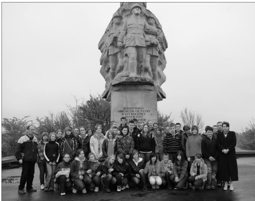
Mokra – pomnik walczących 1 IX 1939 r.

Po obiedzie w pobliskiej miejscowości młodzież ruszyła w dalszą podróż. Ko-