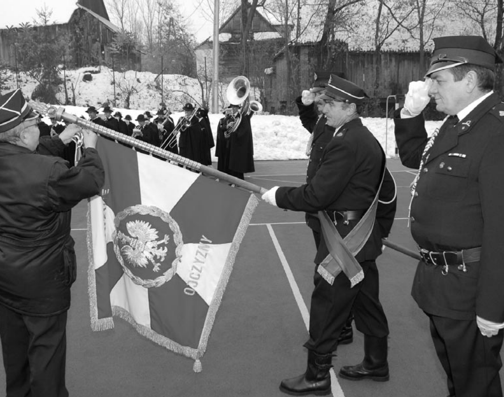
Dekoracja sztandaru