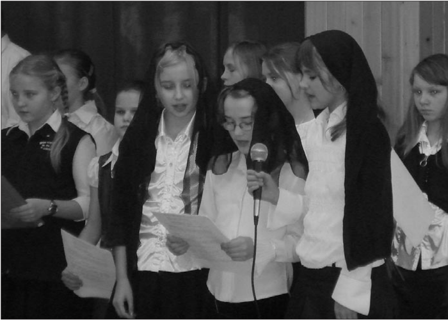
Młodzież recytowała wiersze i śpiewała piosenki legionowe