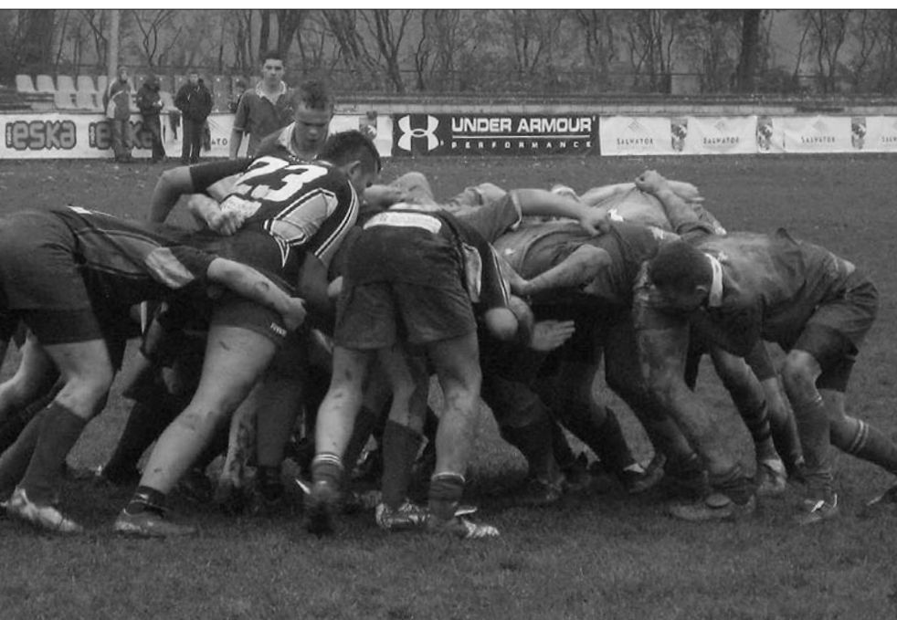
Młodzi górale na pewno nie będą chłopcami do bicia w rozgrywkach ogólnopolskiej Olimpiady Młodzieży