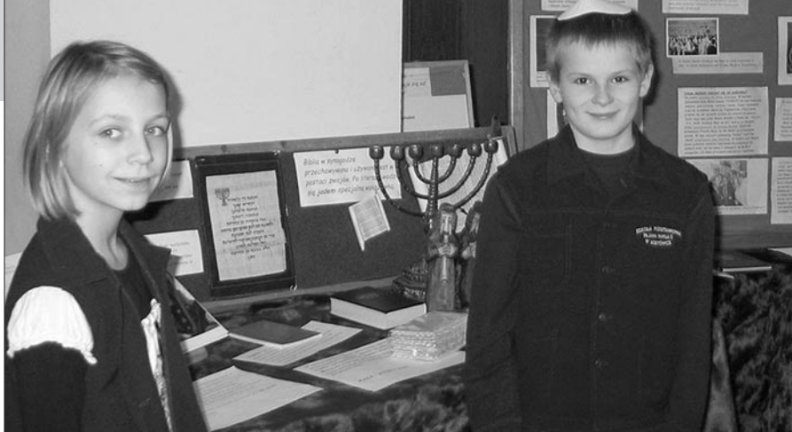
Uczniowie dowiedzieli się co to jest menora i poznali kalendarz żydowski