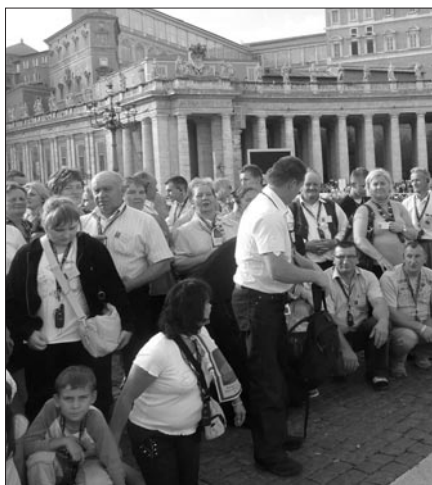
Uroczystość kanonizacji bł. Zygmunta Szczepnego Felińskiego

Następnie pątnicy swoje kroki skierowali do Rzymu, gdzie zwiedzanie rozpoczęli od Bazyliki św. Pawła za Murami.