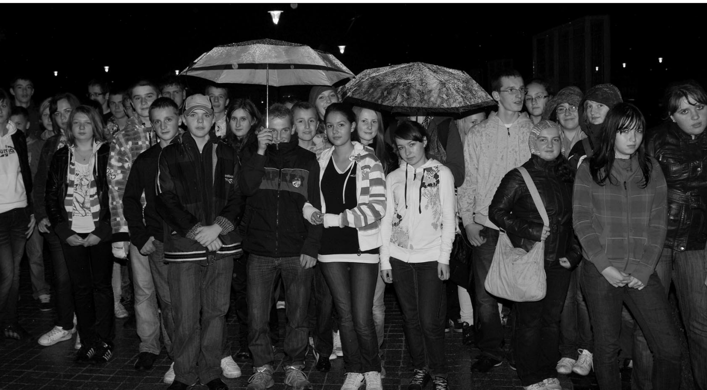
Pod radiostacją gliwicką