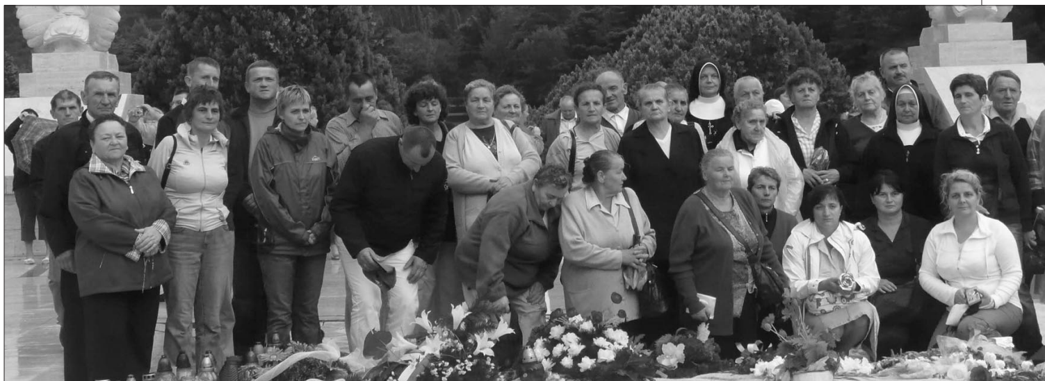
Pielgrzymi z Lubomierza na Monte Cassino

Kanonizacja bł. Zygmunta Szczepnego Felińskiego ciągnęła do Wiecznego Miasta rzesze wiernych z całego świata i stała się także okazją do zorganizowania pielgrzymki z parafii Lubomierz. Wzięło w niej udział 90 osób. Swobodnie w drodze pielgrzymi rozpoczęli 8 października ub. r. Msze w drodze odprowian w kościele parafialnym.