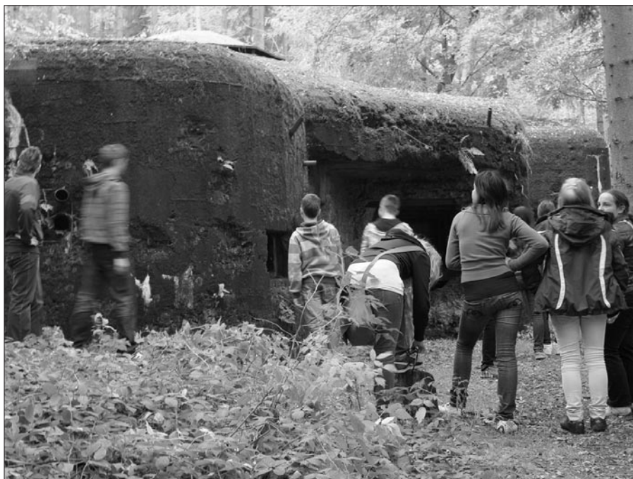
„Waligóra” w Węgierskiej Górcie

ki Boskiej Kłobuckiej na chwilę pogrążyli się w skupieniu i modlitwie. Opiekunowie obejrzeni niedostępne dla zwiedzających pomieszczenia, które zamieszkiwał w XV wieku ówczesny proboszcz Jan Długosz, polski historyk, twórca jednego z najwybitniejszych dzieł średnio-