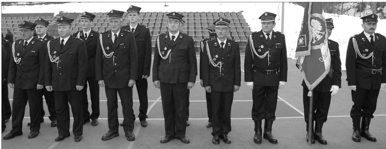
Druhowie z Ochotniczej Straży Pożarnej są dumą Łostówki

Były prezenty, okolicznościowe przemówienia, a życzeniom nie było końca.