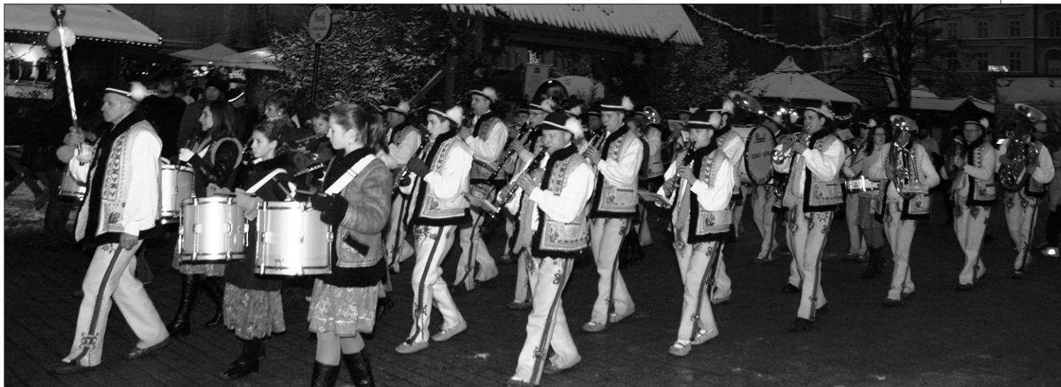
Orkiestra „Echo Gór” przemaszzerowała wokół krakowskiego Rynku