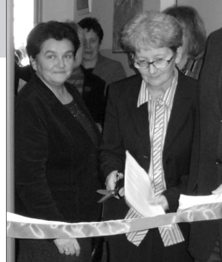
Nie obyło się bez wstęgi i nożyczek