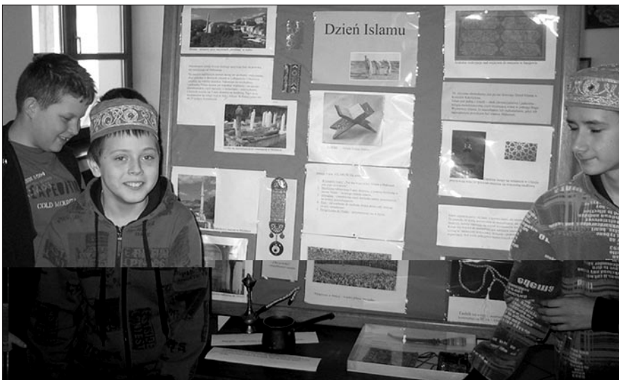
Podczas „Dnia Islamu” dużym powodzeniem cieszyły się arabskie czapeczki