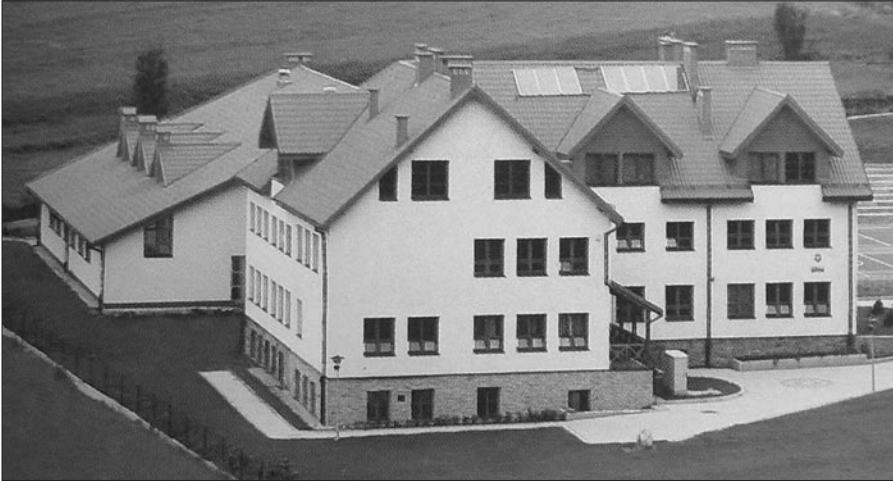
Współczesny budynek szkoły w Łostówce