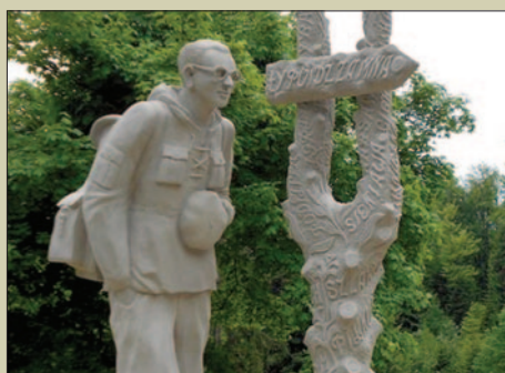
Rzeźba ks. Karola Wojtyły Turysty- -Wędrowca będzie na Śnieżnicy! STR. 15