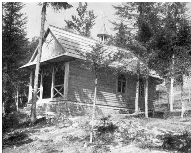
Wielkie dzieło Związku sodalicji marj. uczniów szk. średn. w Polsce. Kolonia wakacyjna sodalicistów na Śnieżnicy w Beskidach (myśl rzucona jesienią r. 1927).