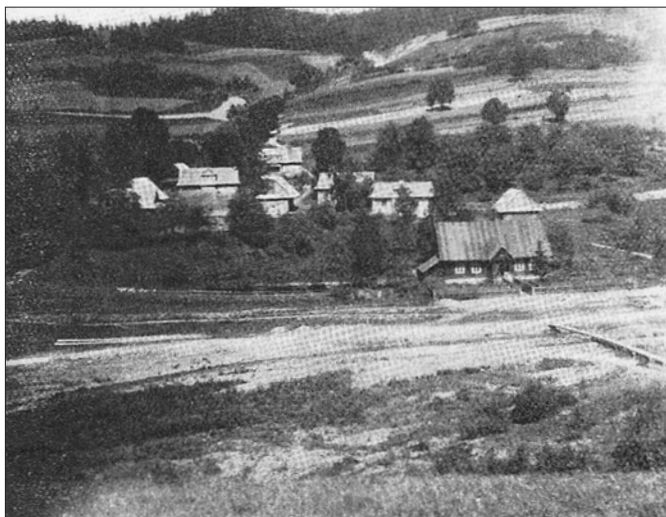
Osiedle Ciemniaków i szkoła podstawowa

odbywały się dzienne zajęcia lekcyjne oraz wieczorowe z dorosłą młodzieżą, a także zebrania gromadzkie. W 1956 roku na zebraniu gromadzkim powołany został Komitet Budowy Szkoły, który z zapałem rozpoczął prace przygotowawcze do budowy nowej szkoły tj. zaczęto łamać kamień i zwozić go na plac budowy. Mimo braku opracowanej dokumentacji budynku, ludność wsi rozpoczęła budowę własnymi siłami. Dzięki staraniom Komitetu otrzymano fundusze z Powiatowej Rady Narodowej, za które zakupiono materiały budowlane, tj: wapno, cement, pustaki i dachówkę. Gdy w 1959 roku otrzymano dokumentację i nareszcie rozpoczęto budowę szkoły. W maju wylano beton w ławy, a we wrześniu wmurowywano pierwsze cegły w fundamenty. Również uczniowie czynnie wspierali prace przy budowie. W wolnych chwilach pomagali w zwózce i rozładunku materiałów oraz powołała Szkolne Koło Społecznego Funduszu Budowy Szkół, w którym po-