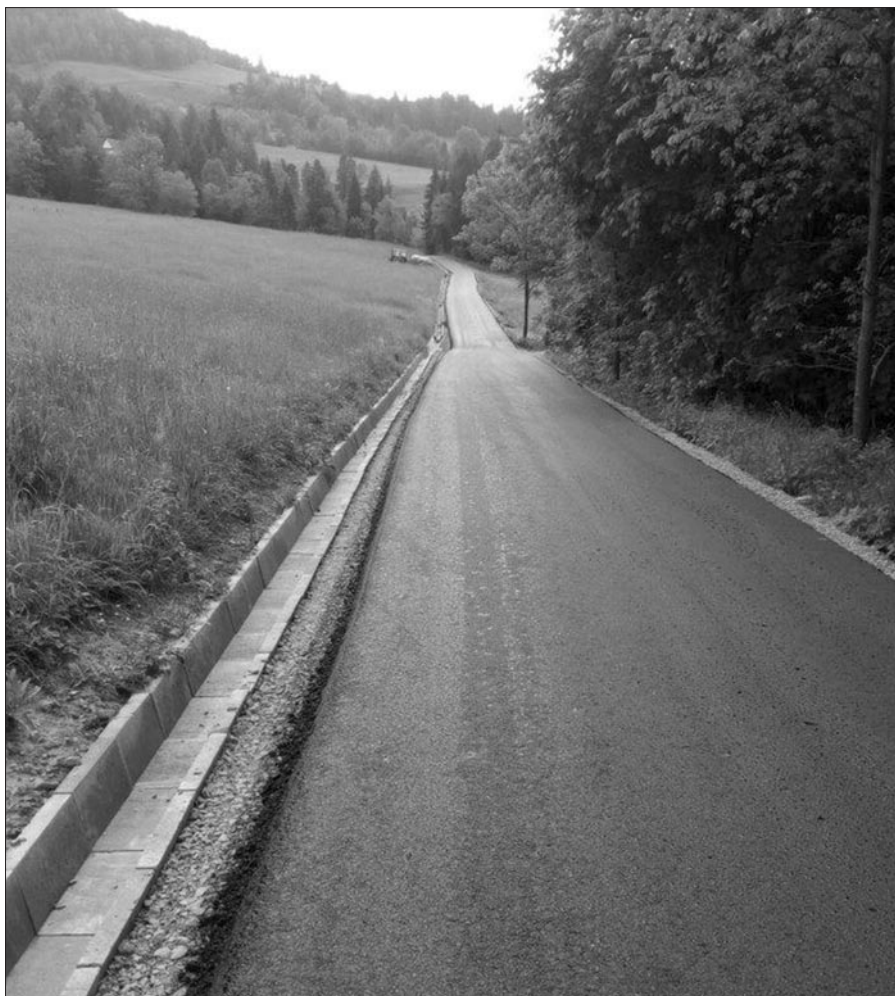
Droga os. SNOZY w Łętowem

Opr. REFERAT INWESTYCJI URZĘDU GMINY W MSZANIE DOLNEJ