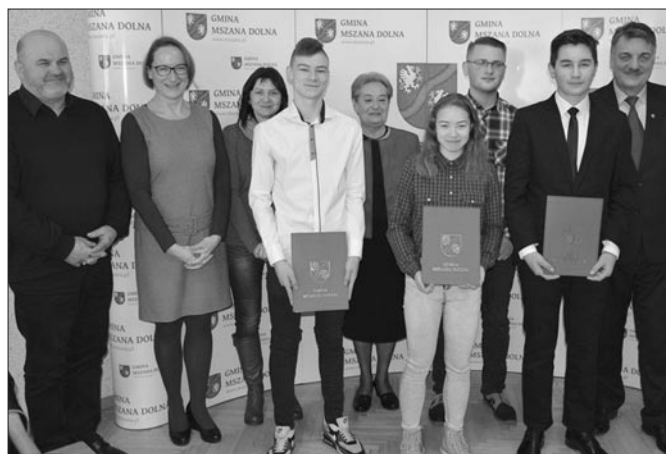
Nagrodzeni za szczególne osiągnięcia w dziedzinie kultury i sportu