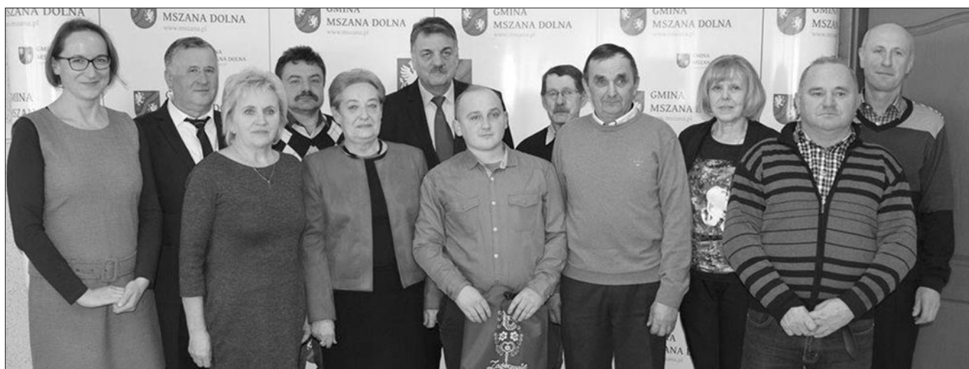
Sołtysi Sołectw w Gminie Mszana Dolna