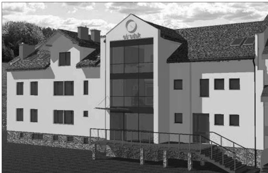
Ośrodek Zdrowia w Mszanie Górnej – wizualizacja

Otrzymaliśmy promesę z Ministerstwa Spraw Wewnętrznych i Administracji