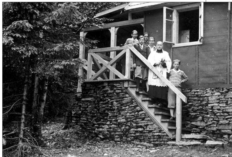
Poświęcenie pierwszego budynku na Śnieżnicy