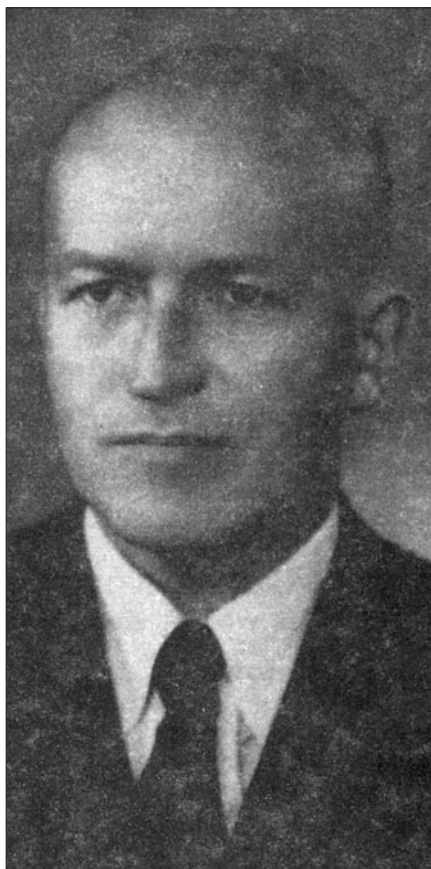
FOT. MATERIAŁY ETNOGRAFICZNE Z POWIATU LIMANOWSKIEGO

Reprezentował województwo krakowskie na Kongresie Kultury w Warszawie. Angażował się w prace społeczne GS SCH i Spółdzielczości Ogrodniczej; był społecznym członkiem Zarządu Banku Spółdzielczego w Mszanie Dolnej (od 1975 do 9 czerwca 1978 r.). Był również prezesem koła pszczelarzy w Mszanie Dolnej (do 1976 r.) i członkiem Zarządu Powiatowego oraz Wojewódzkiego Polskiego Związku