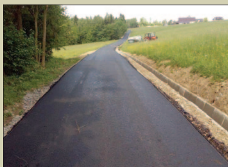
Inwestycyjna wiosna 2018 STR. 8