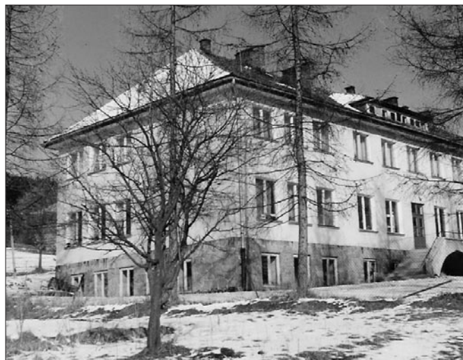
Szkoła w latach 1969-1995