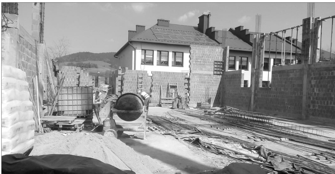
Plac budowy sali gimnastycznej w Mszanie Górnej