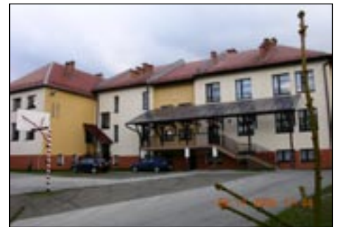
Szkoła Podstawowa nr 2 w Mszanie Górnej.