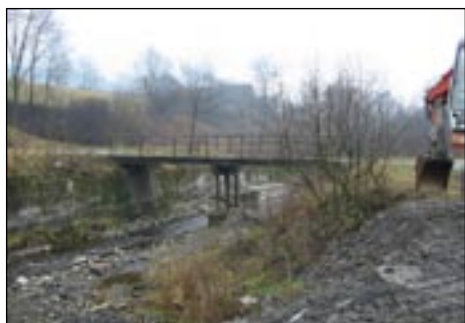
Most do osiedla Droble w Łostówce - tak było