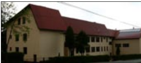
Szkoła Podstawowa nr 2 w Lubomierzu