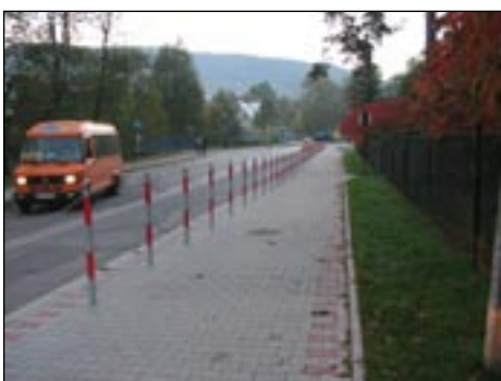
Chodnik w Kasinie Wielkiej wzdłuż drogi wojewódzkiej.