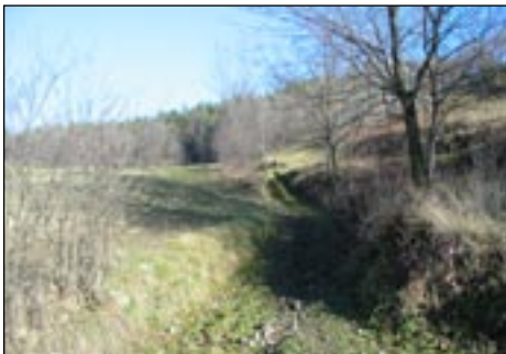
Droga do osiedla Kazamaty w Kasince Małej - tak było