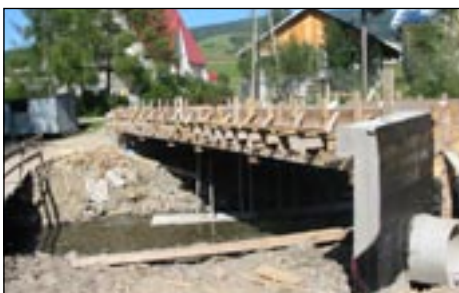
Most do osiedla Pawlaki w Łostówce w trakcie realizacji.