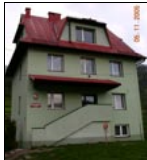
Szkoła Podstawowa nr 1 w Mszanie Górnej.