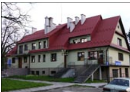
Orodek zdrowia w Kasinie Wielkiej.