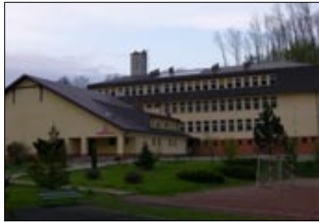
ZPO w Kasince Małej.