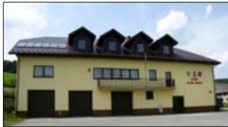
OSP w Ranie Ni njej.