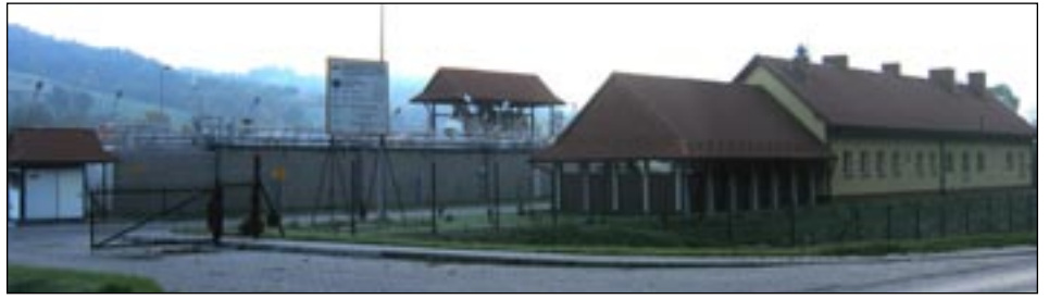
Oczyszczalnia ścieków dla Kasinki Małej i części Kasiny Wielkiej w Lubniu