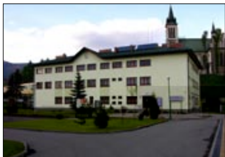
Siedziba Urzędu Gminy w Mszanie Dolnej.