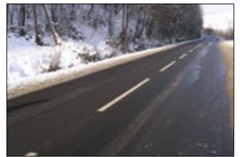
Droga wojewódzka w Mszanie Górnej.