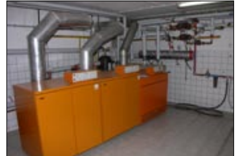
Kotłownia w ZPO w Kasinie Wielkiej, bud. A.