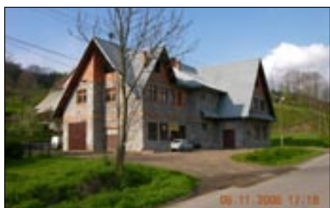
OSP w Łostówce przed termomodernizacją.