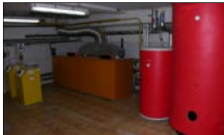
Kotłownia w ZPO w Kasinie Maliej.