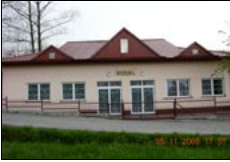
wielica w Lubomierzu