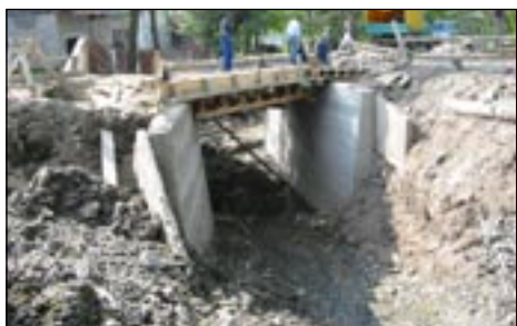
Most Frankówka w Lubonierzu w trakcie odbudowy.