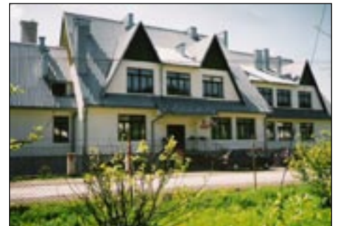
Szkoła Podstawowa nr 1 w Łowicze - tak było