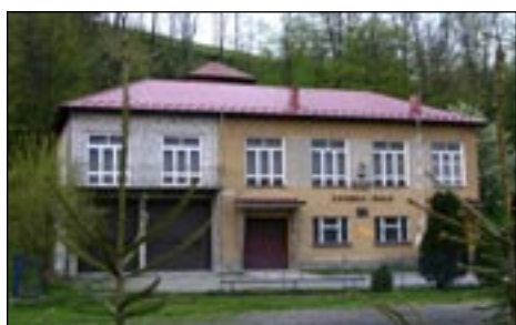
OSP w Kasinie Małej przed termomodernizacją.