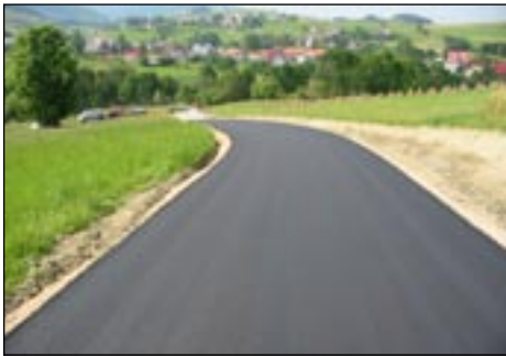
Królewska Góra - centrum wsi - nowa nawierzchnia.