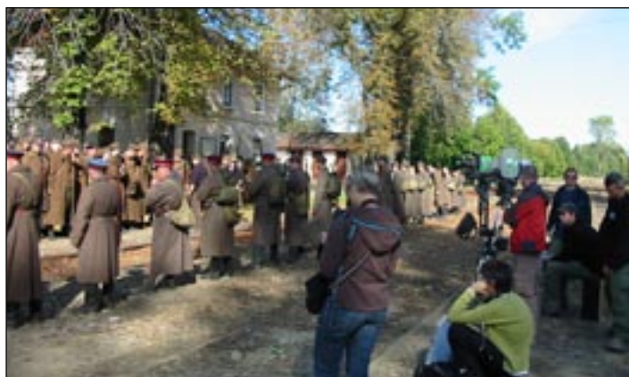
Na planie filmowym u Andrzeja Wajdy – str. 28