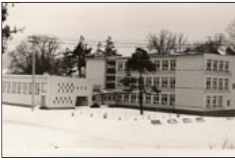
ZPO w Kasinie Wielkiej, budynek A – tak było