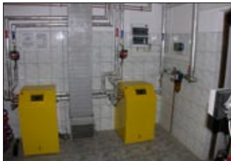
Kotłownia w Szkole Podstawowej w Ł. towie