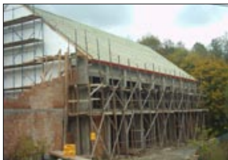
Sala gimnastyczna przy ZSiP w Olszówce - w budowie