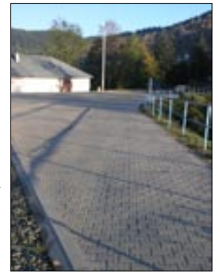
Parking w centrum wsi Lubomierz