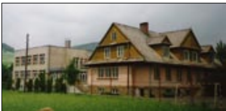
Szkoła Podst. nr 2 w Kasince Małej - tak było