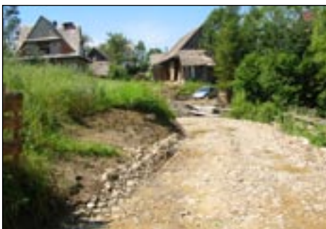
Droga Królewska Góra w Lubomierzu - tak było