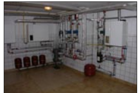
Kotłownia w Mszanie Górnej, SP nr 2