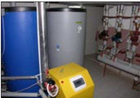
Kotłownia w ZSiP w Olszówce