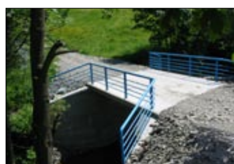
Most do osiedla Łęcki w Łostówce