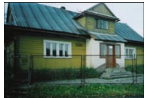
Szkoła Podstawowa w Kasince Wielkiej - os. Władysława