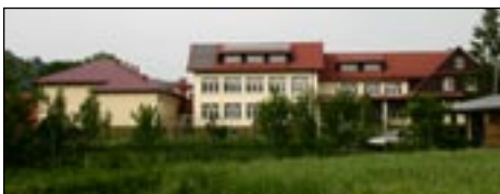
Szkoła Podstawowa nr 2 w Kasince Małej.