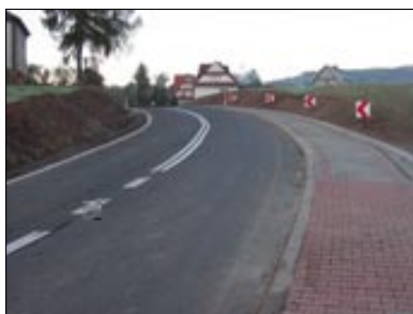
Przebudowa drogi wojewódzkiej i chodnik w Kasinie Wielkiej.