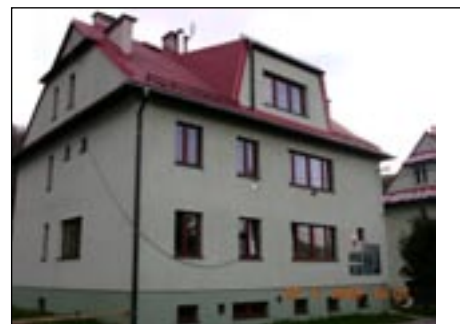
Orodek zdrowia w Mszanie Górnej.