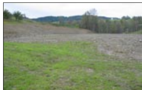
Budowa boiska sportowego w Olszówce