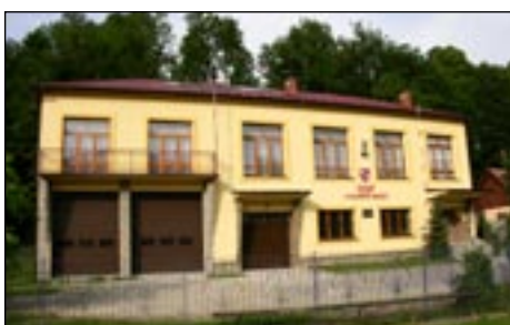
OSP w Kasinie Małej.