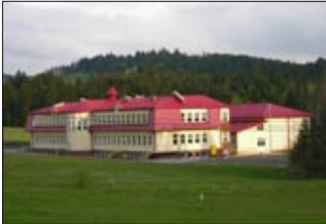
ZPO w Kasinie Wielkiej, budynek B.