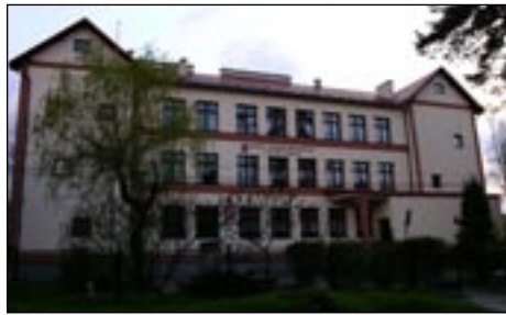
ZPO w Kasinie Wielkiej, budynek A.