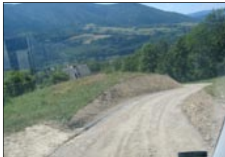
Droga do osiedla Kazamaty w Kasince Małej - obecnie