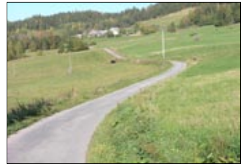
Droga Nowa Wieś w Łutowie