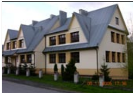
Szkoła Podstawowa nr 1 w Łowicze