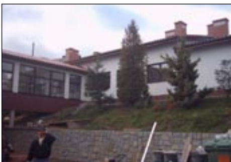
Sala gimnastyczna przy ZPO w Rabeń Niemiański.