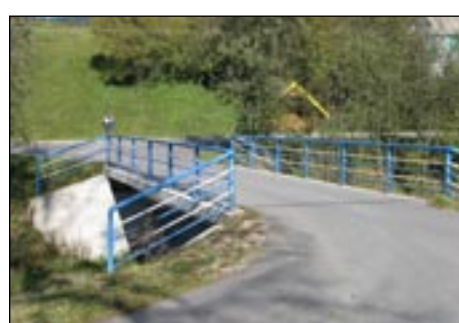
Most do osiedla Droble w Łostówce - stan obecny