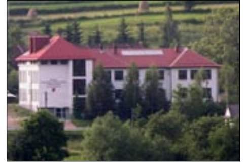
ZPO w Rabeń Niemiański