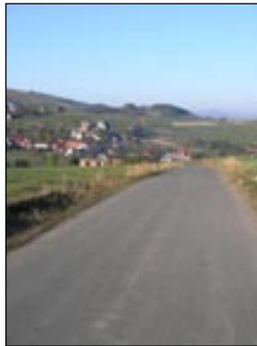
Królewska Góra - centrum wsi w Lubomierzu po realizacji.