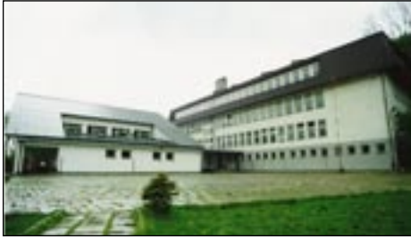
ZPO w Kasince Małej - tak było