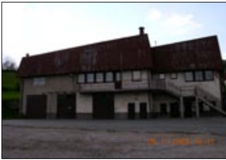
OSP w Ranie Ni njej przed termomodernizacją .