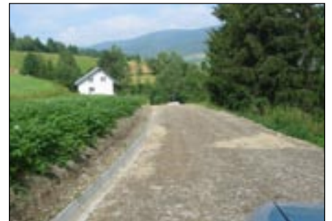
Droga wirowa do osiedla Rusiny w Kasince Wielkiej.