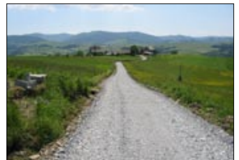
Droga Mszana Góra - Nowa Wieś - Łutowie w trakcie realizacji.