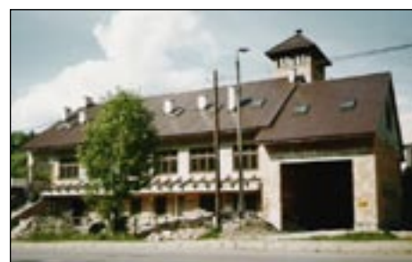
OSP w Lubonierzu - tak było