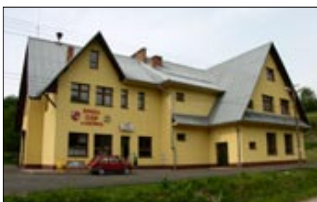
OSP w Łostówce