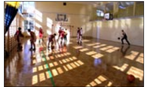
Sala gimnastyczna przy ZPO w Kasinie Wielkiej, budynek B.