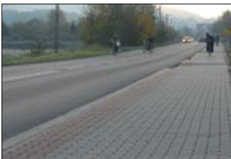
Droga wojewódzka i chodnik w Mszanie Górnej.