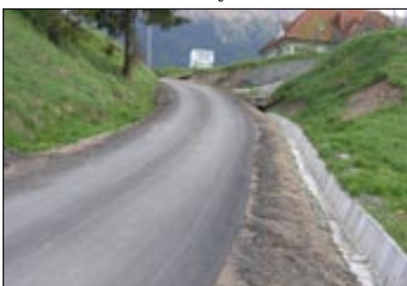
Droga do osiedla Majaronówka w Kasince Małej.