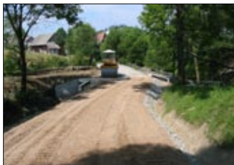
Droga Królewska Góra w Lubomierzu w trakcie realizacji.