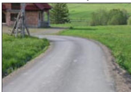
Droga do osiedla i i aki w Kasince Małej.