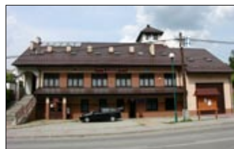
OSP w Lubonierzu.