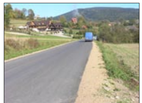
Droga powiatowa w Łostówce