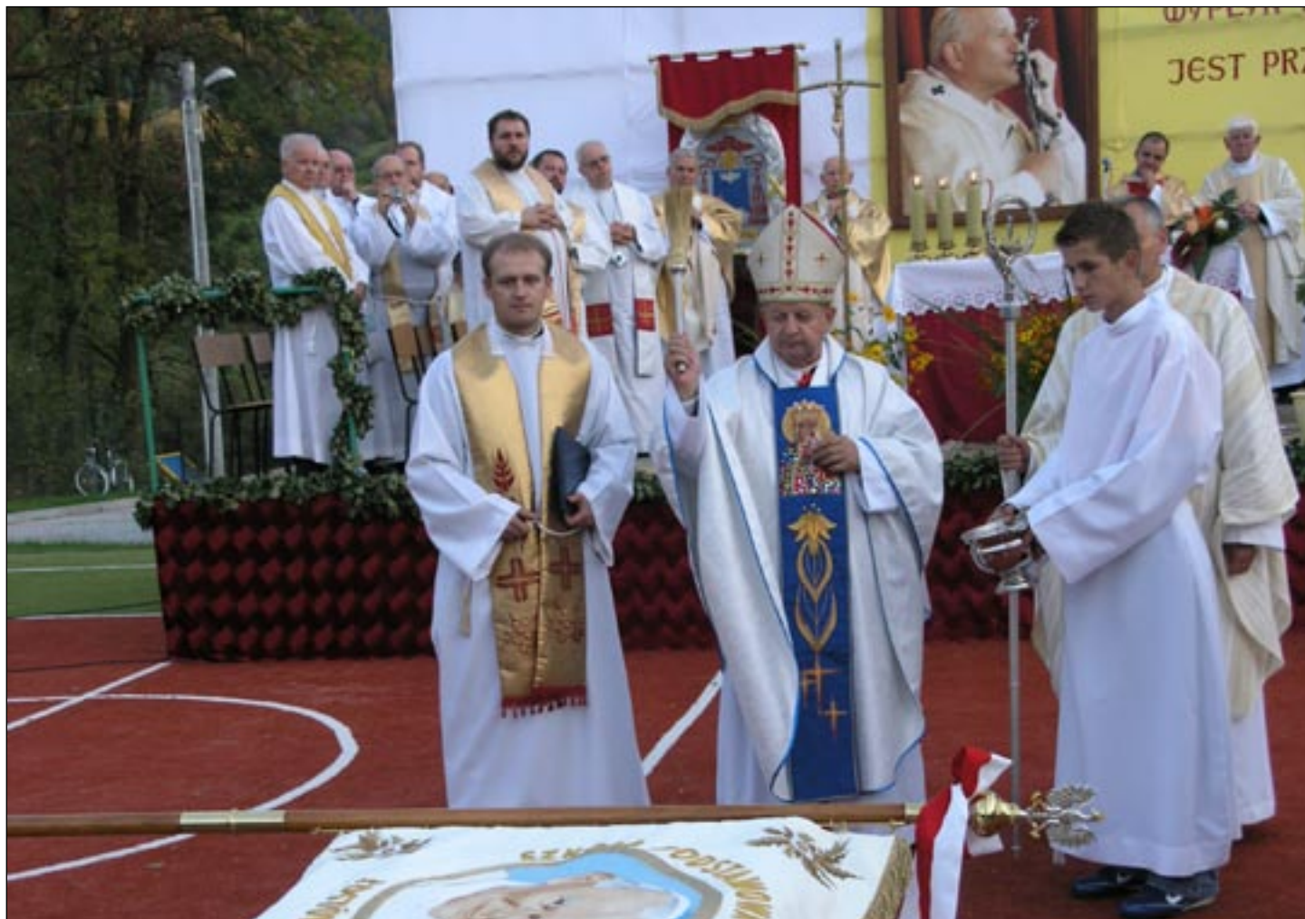
Moment poświęcenie sztandaru Szkoły Podstawowej w Łostówce przez ks. kardynała St. Dziwisza – str. 16-17