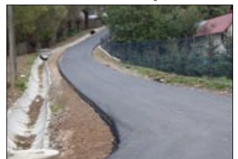
Droga do osiedla Dziedziny w Łutowie w trakcie realizacji.