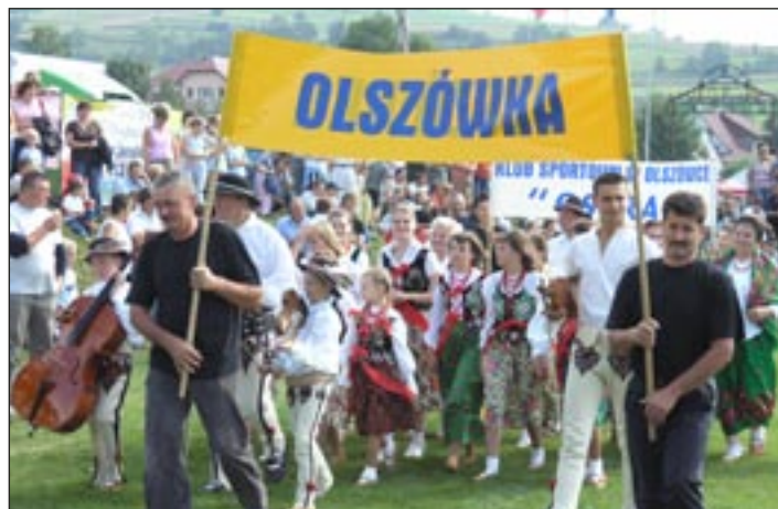
V Turniej Wsi Gminy Mszana Dolna - str. 10