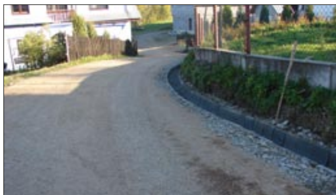
Droga do osiedla Dawczaki - w trakcie wykonania.

W trakcie wykonania są również drogi: do os. Nowaki, Bulaki, Cholewy-Podcholewy, Mądrówka w Lubomierzu, Żury w Olszówce, remont przepustu i wyk.dróżki w Glisnem, Nowa Wieś w Łętowie i Mszanie Górnej, Pietry w Kasinie Wielkiej.