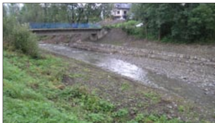
Zabezpieczenie hydrotechniczne mostu w ciągu drogi do os. Waligóry w Olszówce - roboty w trakcie.