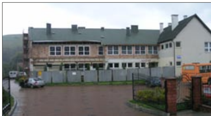
Nadbudowa piętra budynku Gimnazjum w Mszanie Górnej.