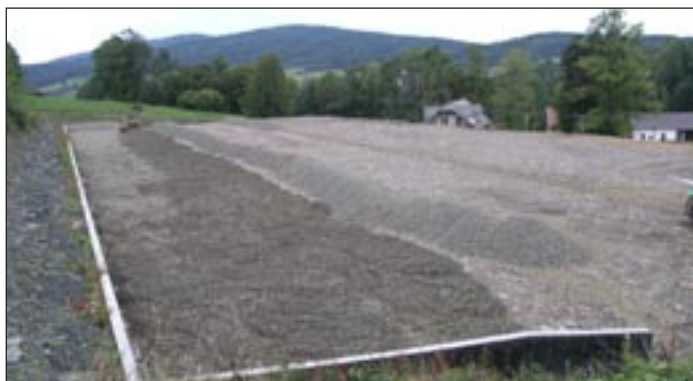
Boisko w Kasinie Wielkiej.