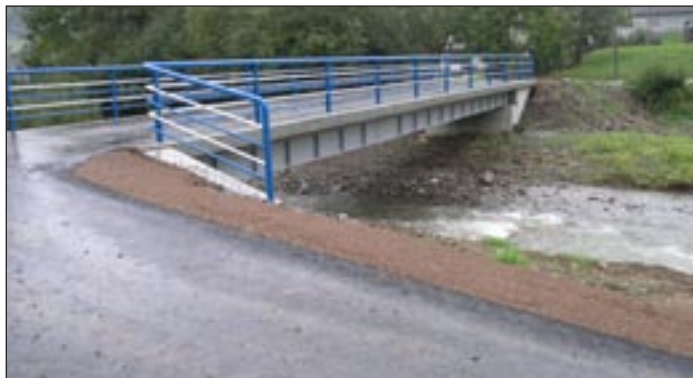
Obudowa mostu w ciągu drogi do osiedla Buloki w Łostówce.