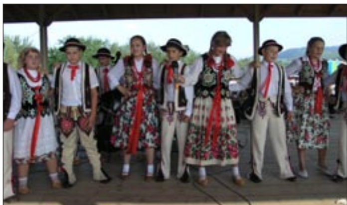
Grupa teatralna ze Sz. P. Nr 2 w Mszanie Górnej.