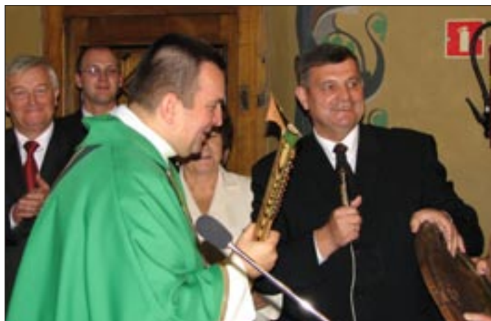
Przeor z ciupag - str. 9