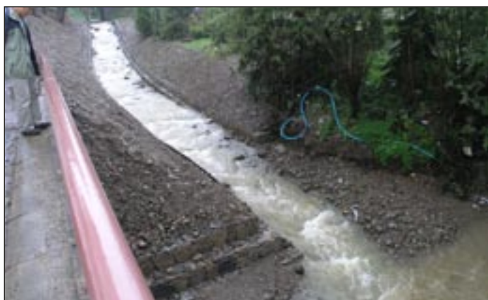
Zabezpieczenie hydrotechniczne Most do os. Krzyszki w Łętowie.