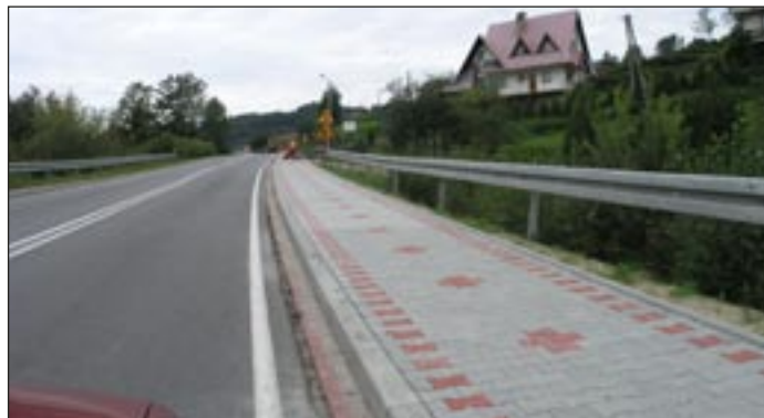
Wykonanie chodnika w Rabie Niżnej.