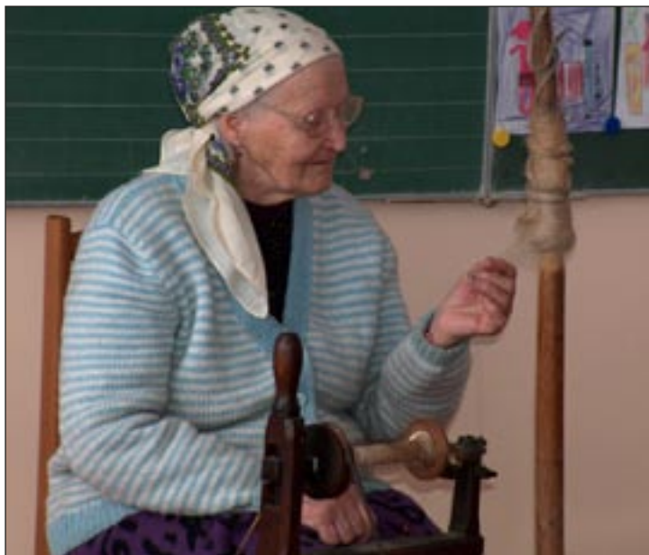
Pokaz przędzenia lnu