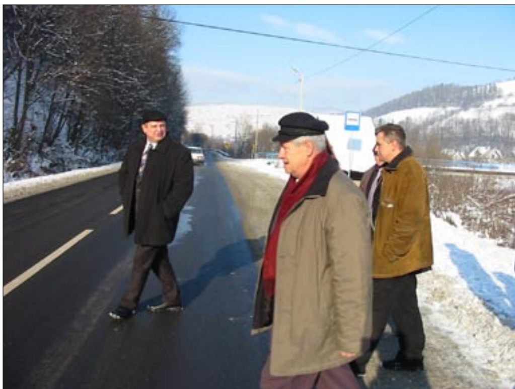
Odbiór techniczny zmodernizowanego odcinka drogi wojewódzkiej w Mszanie Górnej