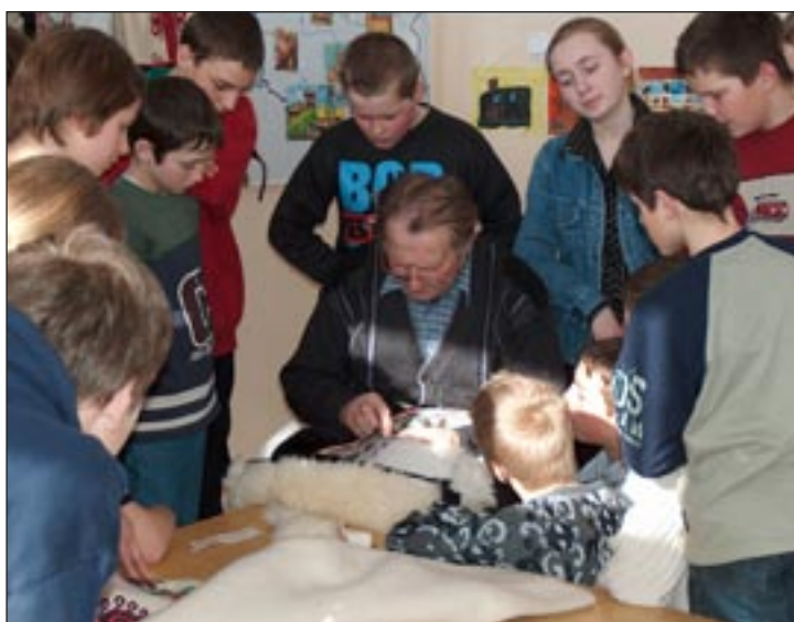
Spotkanie z kuśnierzem